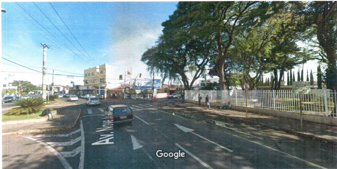
Captura da imagem: jul. 2019 © 2021 Google